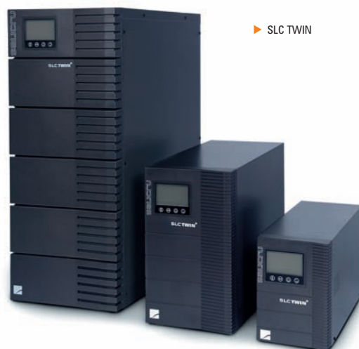
► SLC TWIN