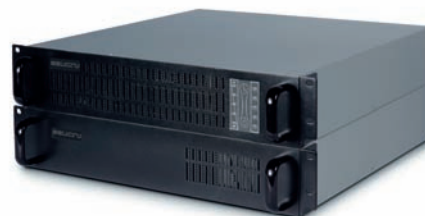
► SLC TWIN RACK 19"