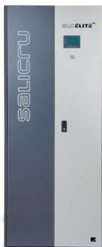
► Equipo SLC ELITE