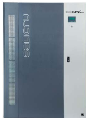
► Equipo SLC ELITE MAX