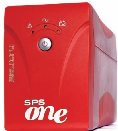
► SPS One