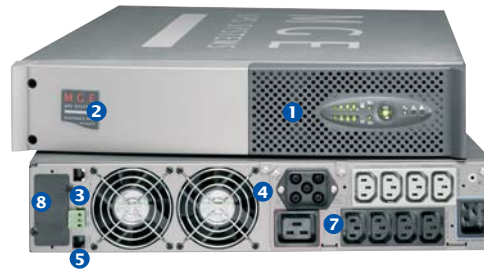
Evolution S 3000 RT2U Netpack