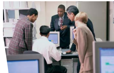
Gracias a sus múltiples posibilidades de instalación, Evolution se integra fácilmente en todos los entornos: oficinas, terminales de puntos de venta, rack 19"...