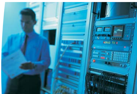
Gracias a su volumen extremadamente pequeño, Evolution es la solución ideal para optimizar el espacio disponible.