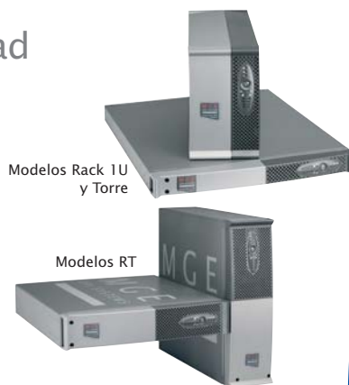
Modelos Rack 1U y Torre